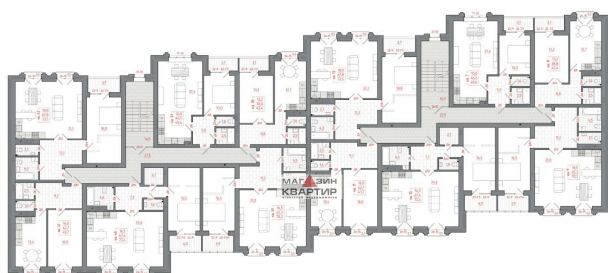
План 2-го этажа